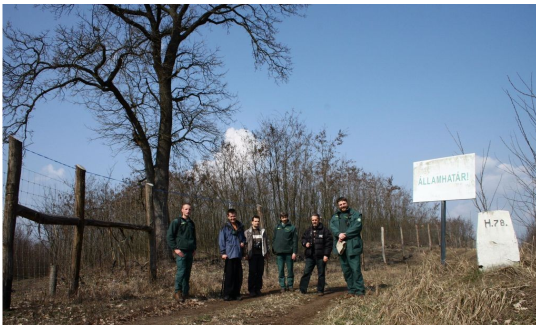
Szakemberek egy csoportja a Takó-hegyen