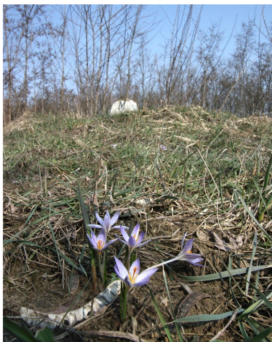
A bagaméri Takó-hegy védett tarkasáfrányai a határsávban

Fülöp község határában a botanikai értékei, valamint ürge állománya miatt kiszemelt Bivalyrét; Pocsaj mellett a jelentős szíki kocsord állománynak termőhelyéül szolgáló Kis-gyomai szikes rét várja a helyi képviselő-testületek döntését. Bagamér esetében, pedig a valóban az országhatár vékony – korábban senki földjének hívott – sávjában található tarkasáfrányos várja a védelmet garantáló döntést a takó-hegyei erdők tövében.