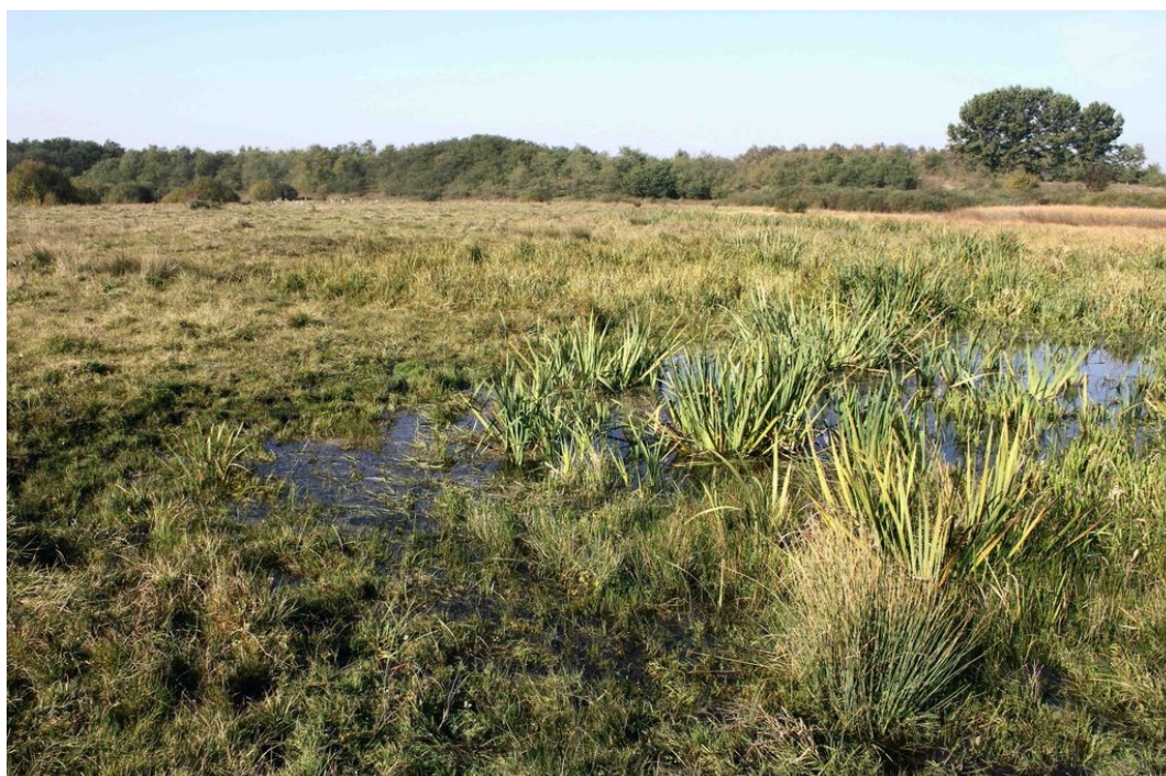
A fülöpi Bivaly-rét ősszel

Hajdú-Bihar és Bihar természeti értékeinek védelméért HURO 0801/218